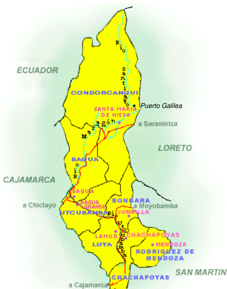
Gráfico n°1: mapa de ubicación

Los awajun y wampis utilizan medios y códigos simbólicos para comunicarse, éstos se manifiestan a través de sonidos, símbolos e imágenes, que permiten un acercamiento de la comunidad en determinadas situaciones. Así por ejemplo, el Tuntui (Manguaré), Kachu (Bocina), y Kankan (Aleta de árbol), son usados en ceremonias de toma de ayahuasca, muerte, accidentes, fiestas, entre otros usos. Actualmente, la tecnología esta presente en algunas comunidades, como Belén, Yutupis y Puerto Galilea, que cuentan con medios de comunicación modernos como son el teléfono, radiofonía y televisión.